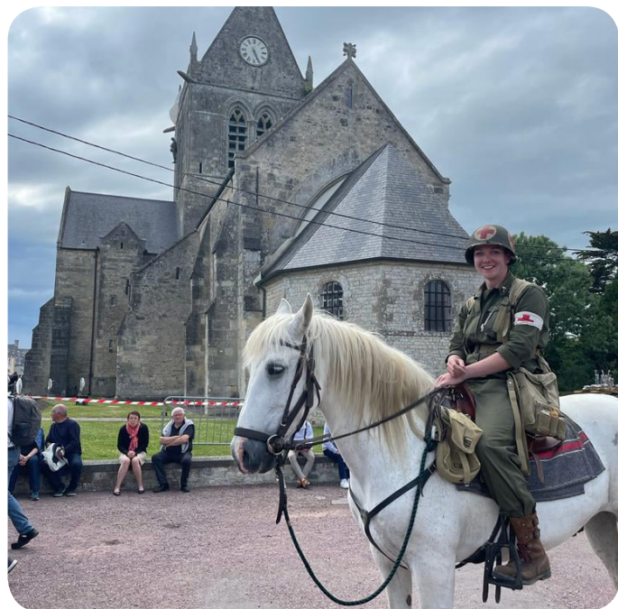
Op het paard in St-Mère-Église.