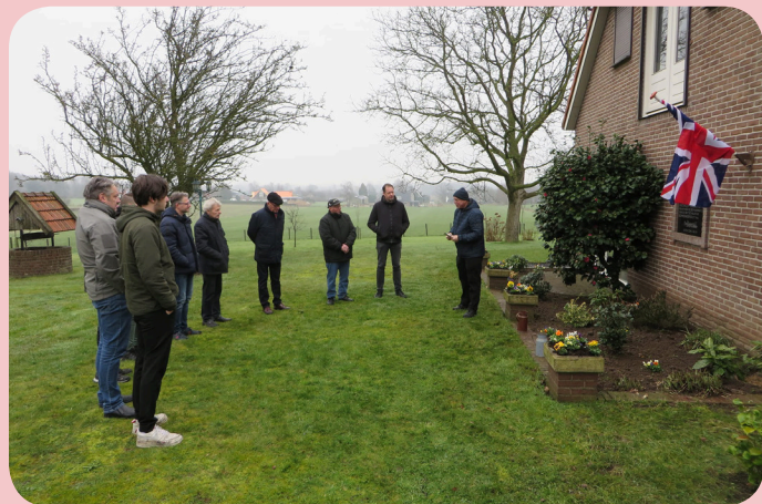
Een kleine geïmproviseerde herdenking bij het Halifax monument op de Sint Jansberg.