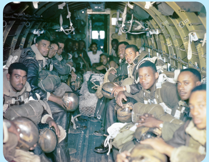
Paratroopers van de 'Triple Nickles' in 1945

Een primeur, het eerste onderdeel Afro-Amerikaanse soldaten dat onderdeel ging uitmaken van een blanke divisie. Hierbij moeten we niet uit het oog verliezen dat, ondanks Gavin's goede bedoelingen, dit natuurlijk nooit was gebeurd als het 555th zich niet had bewezen als een goede gevechtseenheid. Gavin ging nog een stap verder, hij wilde een gelijkwaardige behandeling voor zijn Afro-Amerikaanse officieren en soldaten. Hij gaf Afro-Amerikaanse officieren de leiding over diverse companies. En hij integreerde zo ook op belangrijke divisiestaf posities. De grootste stap misschien nog wel dat Afro- Amerikaanse en witte soldaten dezelfde barak gingen delen. Een historisch moment zonder ook maar een racistisch incident. Ja, Gavin was inderdaad kleurenblind.