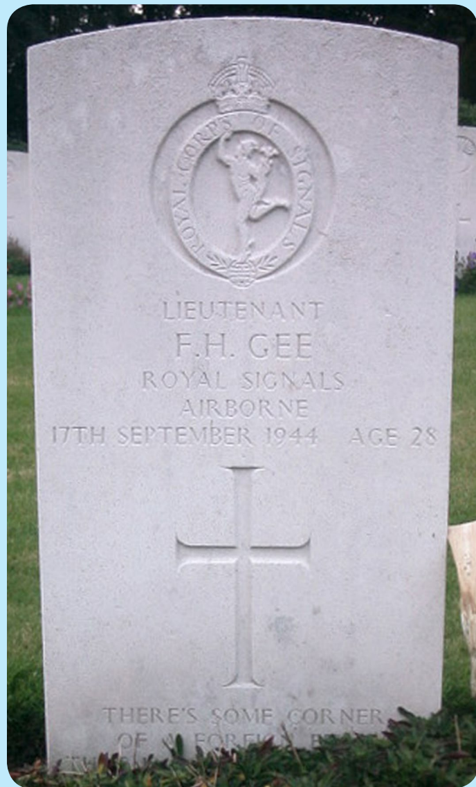
De laatste rustplaats van Fuller Gee op de Erebegraafplaats in Mook.

Met medewerking van Erik Jellema. De volgende bronnen zijn gebruikt: 'Parachute soldier' van William H. Tucker (1995), 'Operation Market Garden, Then and Now' van Karel Margry (2002).