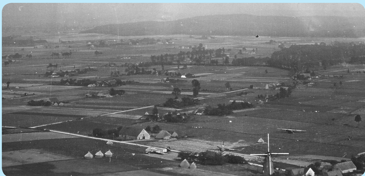
Blik op het landingsterrein van het Airborne Corps HQ met voor in beeld de Bruuksestraat (de huidige Koningin Wilhelminaweg) met rechts de molen ‘De Jonge Hermanus’. De molen zou het oorlogsgeweld dat volgde niet overleven.