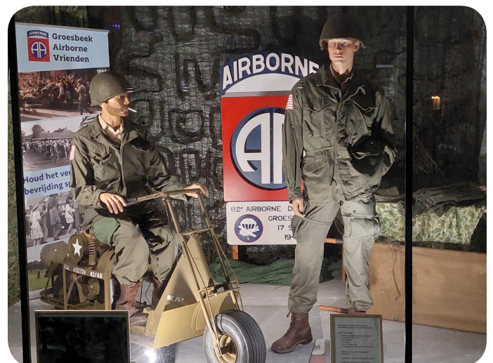
Een blik op de display die gedurende herdenkingsweek te bewonderen was in het centrum van Groesbeek.

Elly was de display 's avonds mooi verlicht. Veel dank ook aan Theo Kuijpers voor zijn belangeloze medewerking.