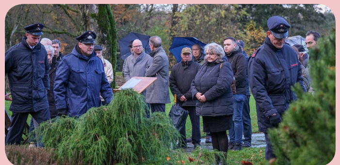
Volkstrauertag op het soldatenkerkhof in Donsbrüggen met een erewacht van de lokale brandweer.

Kerkhoff heeft namens de Airborne Vrienden een bloemstuk gelegd in het mausoleum op de begraafplaats.