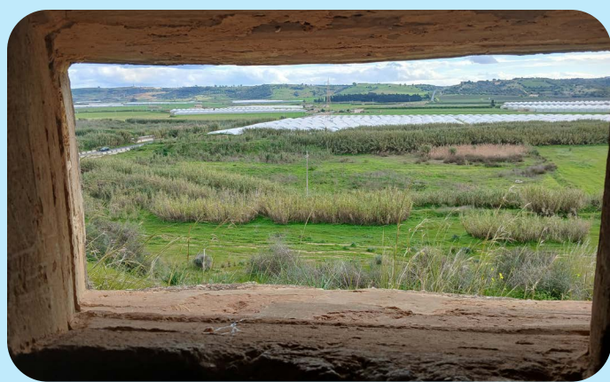
Zicht vanuit een bunker in de omgeving van Ponte Dirillo

Met het arriveren van Gorham en zijn club bij kapitein Sayre was de club inmiddels uitgebreid tot zo'n 75 para's. Samen, onder leiding van Gorham, wisten ze het doel van het regiment veilig te stellen: de Y-splising richting Gela. List en bedrog kwam de bataljonscommandant hier goed bij van pas. De Italiaanse verdedigers gaven zich over nadat er bedreigd werd het scheepsgeschut op hun positie in te zetten. Dat de para's niet in contact stonden met de marine mocht de pret niet drukken.