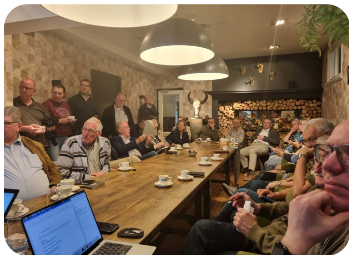
De bijeenkomst van het 82nd Airborne regioplatform kende een mooie opkomst. Het was daardoor 'gezellig druk'.

Airborne Divisie. Het voorlopige programma vind je op pagina 11 van deze nieuwsbrief.