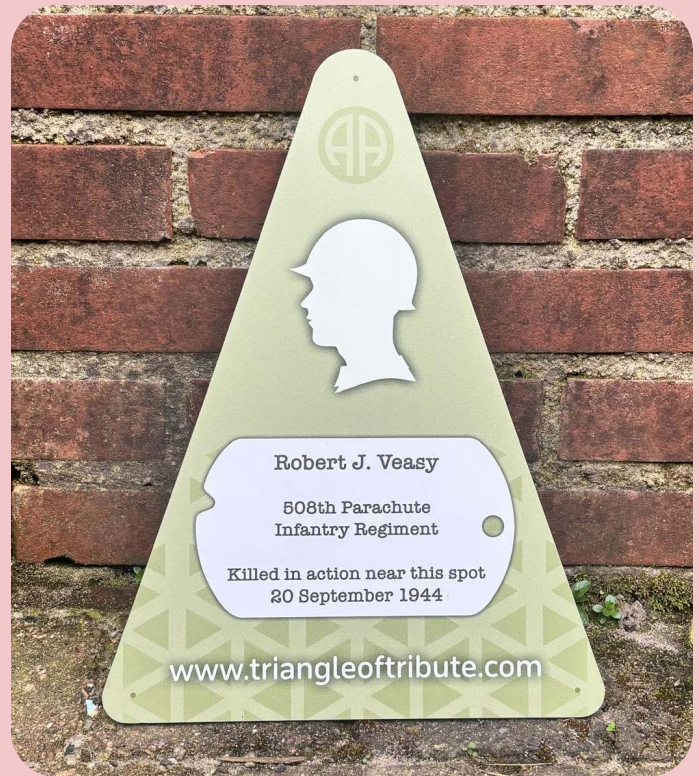
Ontwerp voor de metalen herdenkingsplaatjes voor het project 'Tribute of Triangle'.

We proberen contact te leggen met familieleden en nabestaanden van de gesneuvelde soldaten,