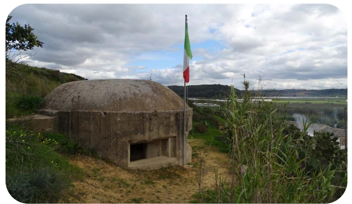
Bunker bij Ponte Dirillo

In de nacht van 9 op 10 juli 1943 begon de invasie van Sicilië met een luchtlandingsoperatie waarbij de Britse 1e Airborne divisie aan de oostzijde van het eiland enkele bruggen en beheersende terreindelen diende te vermeesteren. Door stevige wind raakte de Britse parachutisten en glidertroepen sterk verspreid waarbij vele gliders in zee terecht kwamen met verdrinking van een groot aantal Britse Airborne troepen tot gevolg.