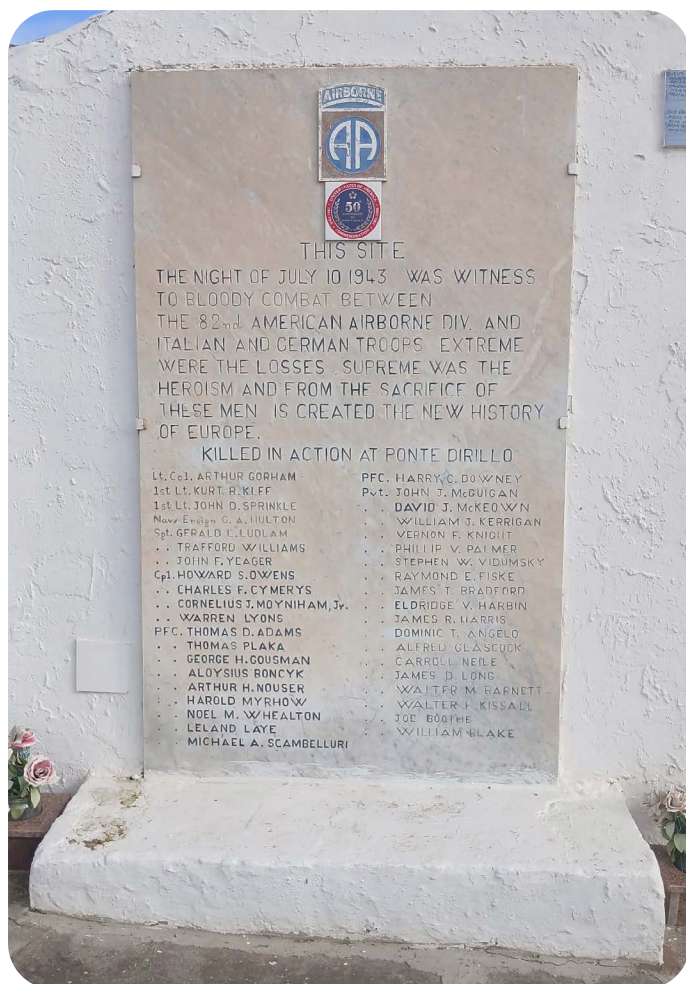
Herinneringsplaquette bij Ponte Dirillo

van de westzijde van de Middellandse zee en een springplank creëren voor de aanval op het Europese vasteland via Italië, zowel via zee als door de lucht. Secundaire doelen waren het opdoen van waardevolle ervaring voor eventuele latere militaire operaties en - eventueel - het versnellen van de capitulatie van Italië. De geallieerde invasiemacht zou het opnemen tegen 200.000 Italiaanse verdedigers en een uitgebreide kustverdediging, alsmede 2 Duitse divisies, waaronder de recent opgerichte Hermann Göring divisie.